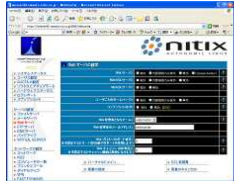
Nitix の日本語版システム設定画面